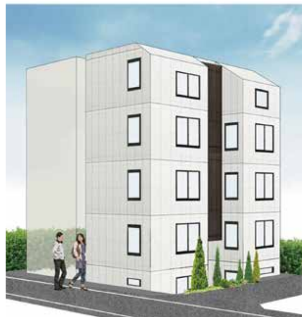
角地のため、日当たり良好です。