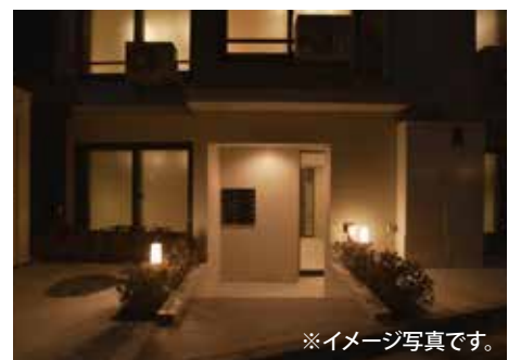
※イメージ写真です。