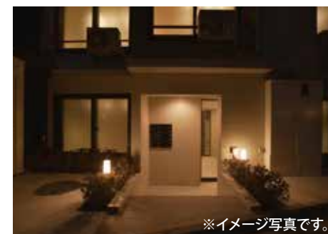
※イメージ写真です。